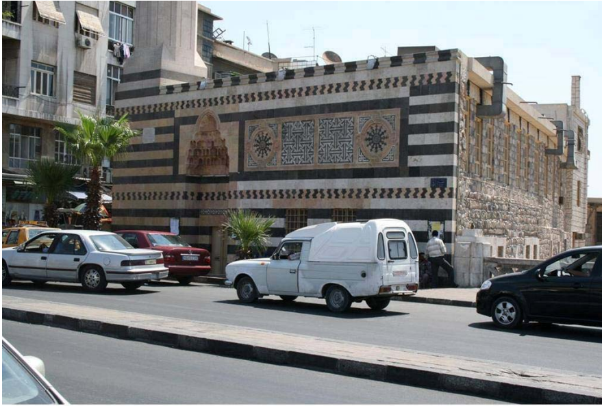
الواجهة الغربية والجنوبية لجامع الثقفي المجددة و المرممة حديثاً / عماد الأرمشي